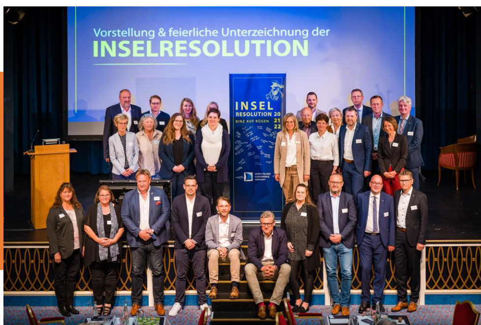
Teilnehmer der Inselkonferenz und Unterzeichner der Inselresolution

Die Resolution enthält klare Ziele und Forderungen in den folgenden sieben Kernthemen: nachhaltige Tourismusedwicklung, Küsten- und Meeresschutz, Mobilität, Müllvermeidung und Kreislaufwirtschaft, lokale landwirtschaftliche Erzeugnisse, Flächennutzung sowie alternative Energiepotentiale. Verbunden ist die Unterzeichnung mit einem Appell und Forderung an die Europäische Union und die nationalen Parlamente, Finanzierungs- und technische Hilfsprogramme für die gezielte nachhaltige Entwicklung der (Halb)Inseln und Halligen zu schaffen und eine:n Inselkoordinator:in in der Bundesregierung zu berufen.